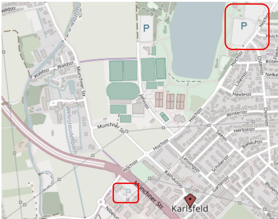
M3 Parkplatz + Parkplatz am See (rote Markierung)